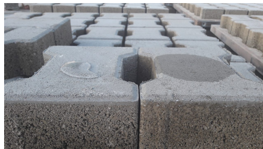
Бетонски елемент третиран со Фасил В